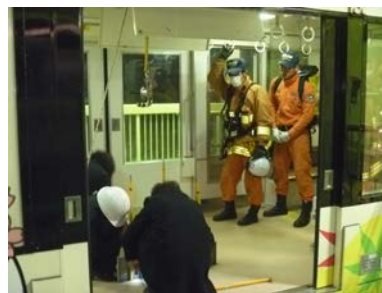
【応急下降器救助訓練】