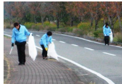
【従業員による地域清掃活動】