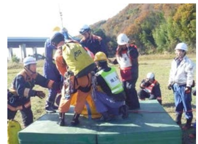
【警察署・消防署合同訓練】