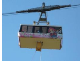
【応急下降器救助訓練】