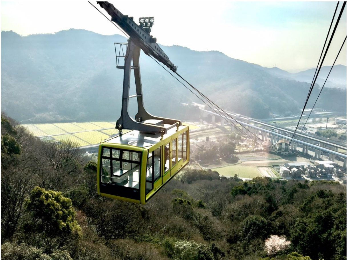
【2018年 新緑とゴンドラ】