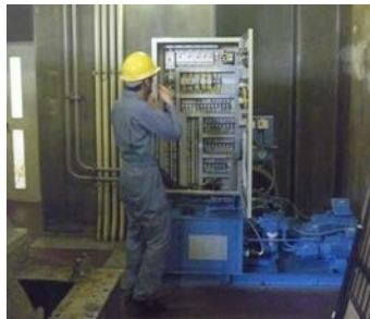
【設備保守点検作業】

2016年度は、応急下降器訓練を5回実施しました。内、1回は姫路警察署・姫路西消防署との立会いにより実施しました。予備エンジンによる運転訓練は4回実施しました。