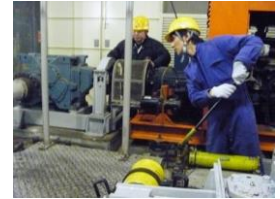
【予備エンジン訓練】